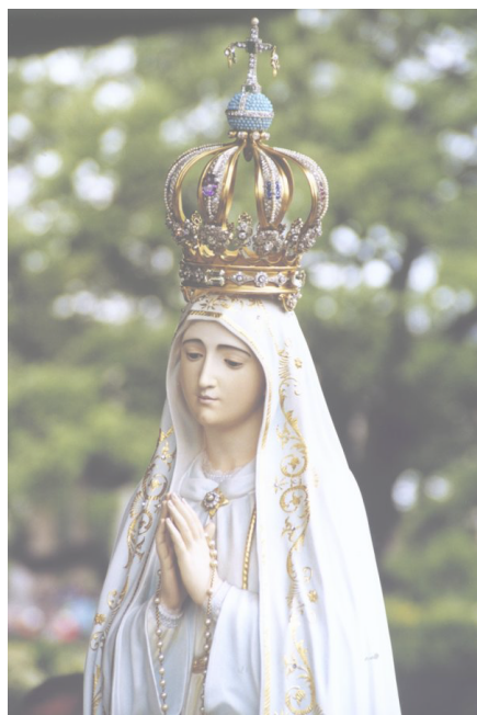
Madonna di Fatima Preghiamo in modo particolare per la pace in Terra Santa

Spinedi: lunedì, mercoledì, giovedì, venerdì e Domenica ore 20.15. Martedì ore 17.00 sabato 16.30.