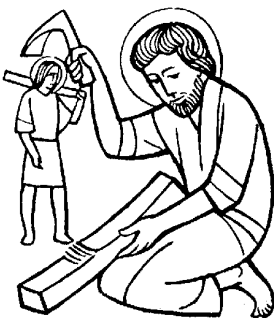
SAN GIUSEPPE LAVORATORE

Quindi il Vescovo verrà accompagnato per la visita all'azienda agricola "La Taiada" per incontrare il settore agricolo. La visita proseguirà all'industria meccanica "Valtecne" e al centro servizi della Banca popolare di Sondrio. Una bella occasione per tante persone della nostra parrocchia e del nostro vicariato di riflettere sui riflessi sociali del Vangelo!