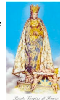
Beata Vergine di Tirano

il pellegrinaggio mattutino. Partenza ore 4.45 dall'oratorio, 5.30 Rosario in basilica a Tirano, 6.00 Messa, ritorno Berbenno ore 7.30 iscrizioni entro martedì 24 in oratorio.