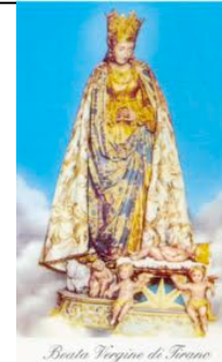
Beata Vergine di Tirano

il pellegrinaggio mattutino. Partenza ore 4.45 dall'oratorio, 5.30 Rosario in basilica a Tirano, 6.00 Messa, ritorno Berbenno ore 7.30 iscrizioni entro martedì 24 in oratorio.